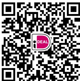
Tweede collecte Vastenoffer