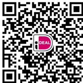
Eerste collecte Parochie

Het is ook mogelijk onderstaande QR-code te scannen met uw bank-app.