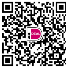
2 e collecte diaconale doelen

Na afloop van de eucharistieviering is er koffie en thee in “In de Driehoek”. U bent hiervoor van harte uitgenodigd.